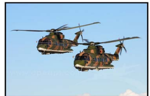
edição nº 1 - www.aepept.com