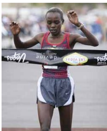
Jemima JELAGAT SUMGONG (Quénia) Nasc.: 21-12-84

Rec. Pessoais 5.000m: 15:40:07 Meia Maratona: 01:07:08 Maratona: 02:22: 39